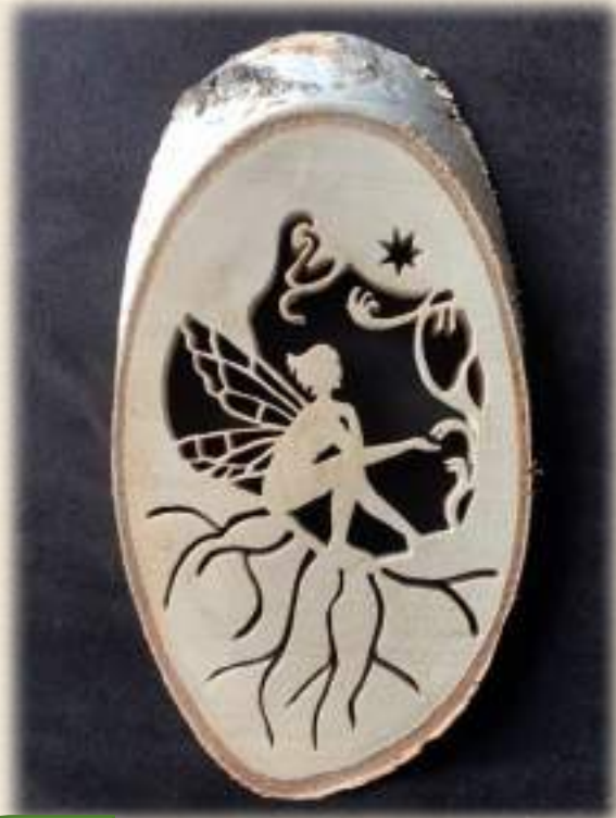
Chantournée dans une rondelle de bouleau en 2 cms d'épaisseur Hauteur 26 cms