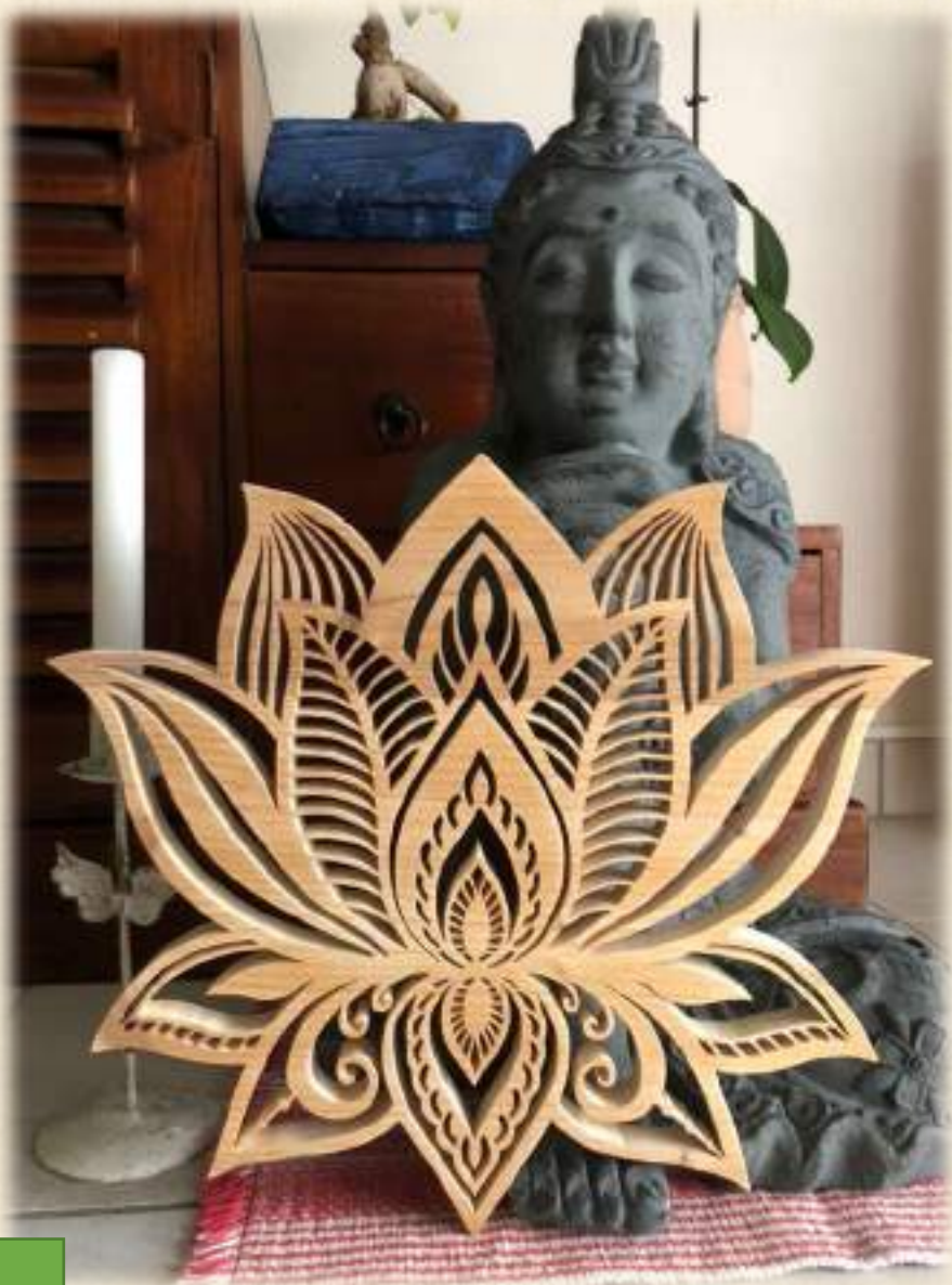
Lotus sacré 45 cms de diamètre Pin