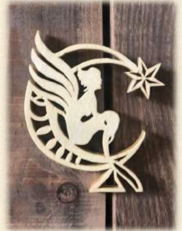
Logo de la Fée des Bois Bouleau contreplaqué 14 cms de diamètre